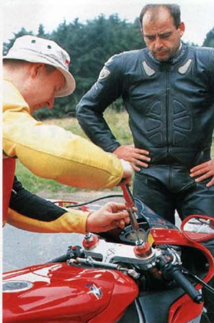
Klick, klick. Schön mitzählen und nicht aus der Ruhe bringen lassen

Ein Fahrwerkstrick, der sich ebenfalls einfach und mit geringen Mitteln realisieren lässt, ist das Höherlegen des Hecks. Anders ausgedrückt: die Schwinge wird steiler angestellt. Speziell Sportmotorräder haben bereits serienmäßig